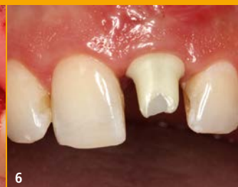
6 Zirkonabutment in situ, per CEREC gefertigt.