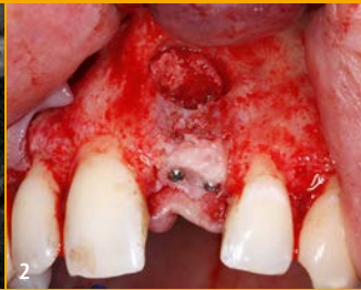
2 Zum Ausgleich des vertikalen Knochenabbaus wurde ein Knochenzylinder apikal aus dem Alveolarfortsatz gewonnen und mit zwei Schrauben krestal fixiert.