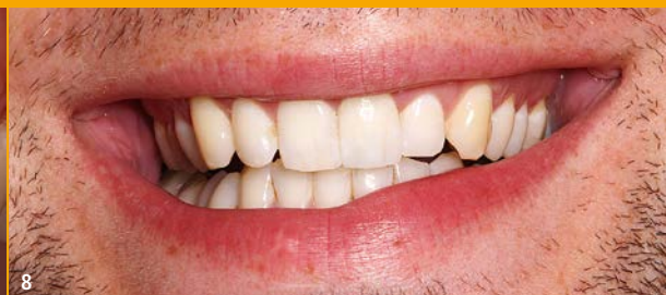
8 Ein zufriedenes Lächeln nach der Behandlung.

im Oberkieferfrontzahnbereich – abgesehen von einer Sofortimplantation – eine Augmentation erforderlich. Entscheidend sind in beiden Fällen, der Sofortimplantation und der Implantation nach Augmentation, ganz verschiedene Eigenschaften des Implantats: Bei einer Sofortimplantation kann es entscheidend sein, dass das Implantat eine perfekte Stabilität aufweist, nachdem es nur mit wenigen Gewindegängen apikal fixiert wurde – der Spalt zwischen der Alveole und dem Implantat wird mit Knochen bzw. einem Knochenersatzmaterialgemisch aufgefüllt.