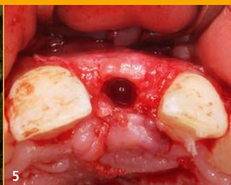
5 Knochensituation nach Membranentfernung und Implantatbettbohrung.