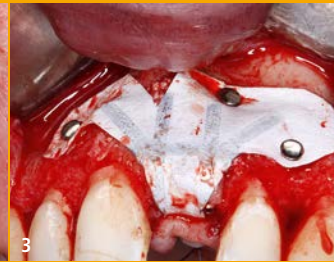
3 Der vestibuläre Knochendefekt wurde mit bovinem Hydroxylapatit und autologem Knochen augmentiert und mit einer nicht resorbierbaren Membran stabilisiert.