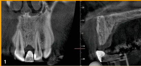
1 Zustand nach Zahnverlust, der Knochen könnte irrtümlich als ausreichend breit angesehen werden, die fehlende vestibuläre Lamelle ist jedoch durch die Darstellung der geplanten Zahnposition gut zu erkennen.

Therapie: zunächst Augmentation, später Implantation