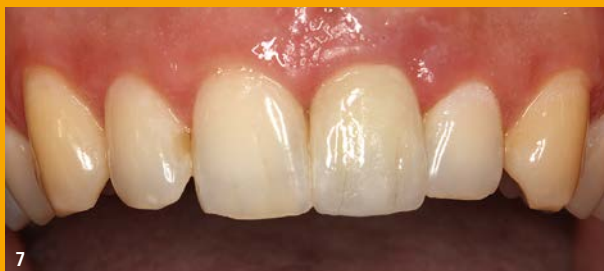
7 Vollkeramische Krone in situ, CEREC-gefertigt.